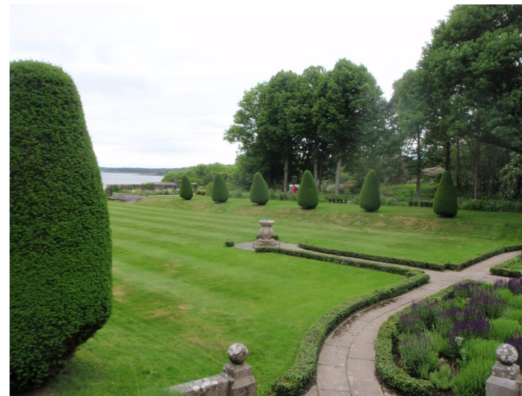
En skön vy mot havet med välansade buskar och gräsmattor.

www.tjoloholmsvanner.se info@tjoloholmsvanner.se